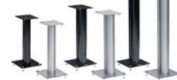
STYLUM SUPPORT D'ENCEINTE