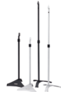
FINN SUPPORT D'ENCEINTE