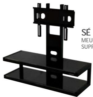
SÉ MEUBLE AVEC SUPPORT D'ÉCRAN