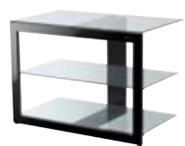
LINY MEUBLE AUDIO VIDÉO