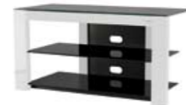
PIÙ AV MEUBLE AUDIO VIDÉO