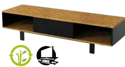
CINEMA MEUBLE AUDIO VIDÉO EN BAMBOU MASSIF