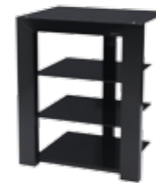
PIÙ MEUBLE HI-FI