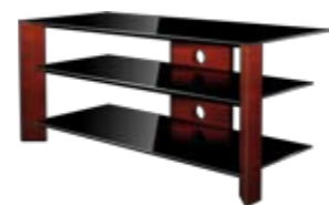
WOODEN MEUBLE AUDIO VIDÉO BOIS MASSIF