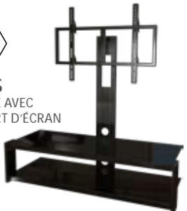
BEOS MEUBLE AVEC SUPPORT D'ÉCRAN