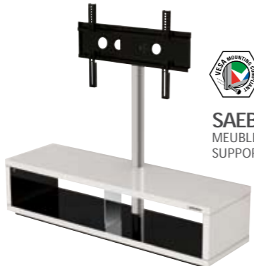
SAEBY MEUBLE AVEC SUPPORT D'ÉCRAN