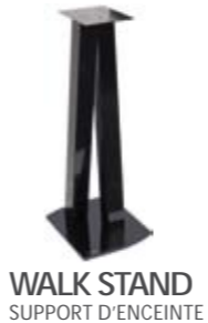
WALK STAND SUPPORT D'ENCEINTE