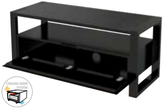
CARLY MEUBLE AUDIO VIDÉO AVEC PORTE