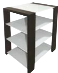
KUBBEN MEUBLE HI-FI