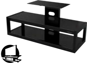
DYVAD MEUBLE AUDIO VIDÉO