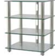
EPUR 4 MEUBLE HI-FI