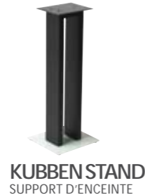
KUBBEN STAND SUPPORT D'ENCEINTE