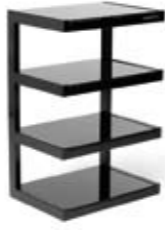
ESSE HIFI MEUBLE HI-FI