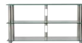
EPUR 3 MEUBLE AUDIO VIDÉO