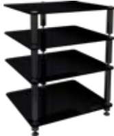
BERGEN 2 MEUBLE HI-FI