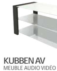
KUBBEN AV MEUBLE AUDIO VIDÉO