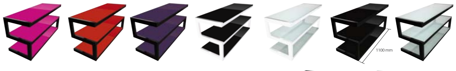
ESSE MEUBLE AUDIO VIDÉO 7 FINITIONS AU CHOIX